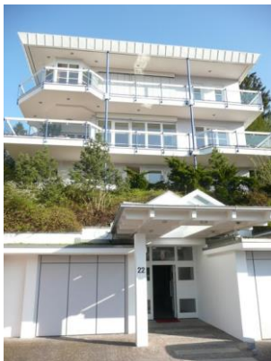
TEAM P Standort Stuttgart

Wir entwickeln die HR-Bereiche und internen Personal- und Organisationsentwicklungen weiter und qualifizieren die Spezialisten in mehrmoduligen Ausbildungen als Coach, Trainer, Moderatoren und Berater. Mit einem engagierten Team betreuen wir alle Kunden direkt und sehr persönlich – digital und in Präsenz. Wir sind überregional und international tätig. Die Projektsprachen sind deutsch und englisch.