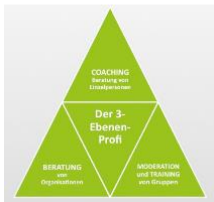
Unsere Arbeit als 3-Ebenen-Profis