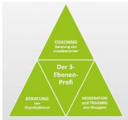
Unsere Arbeit als 3-Ebenen-Profis